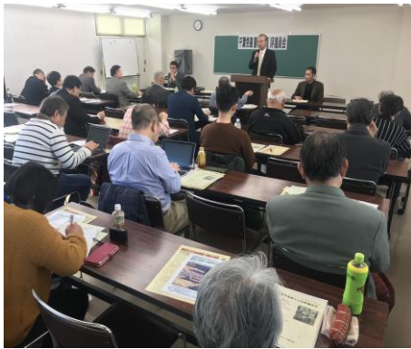
あいさつする本原議長