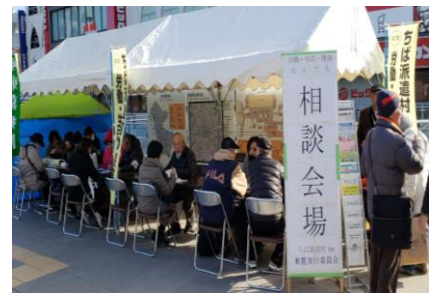
大勢の相談者が訪問

派遣村開催にあたって事前宣伝をおこない、そのチラシで来た人、各市の広報紙への案内掲載を見てきた人、赤旗折り込みを見て来た人たちが、テントに、10 時から 14 時まで切れ間なく相談者が訪れました。年齢層は 10 代から 80 代まで、東葛地域に限らず県外から来た人もいました。